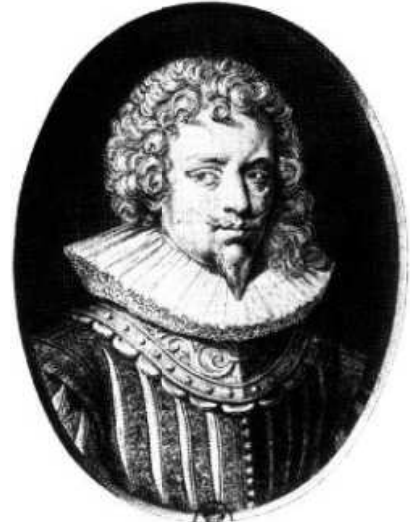
Charles 1 er De Créquy